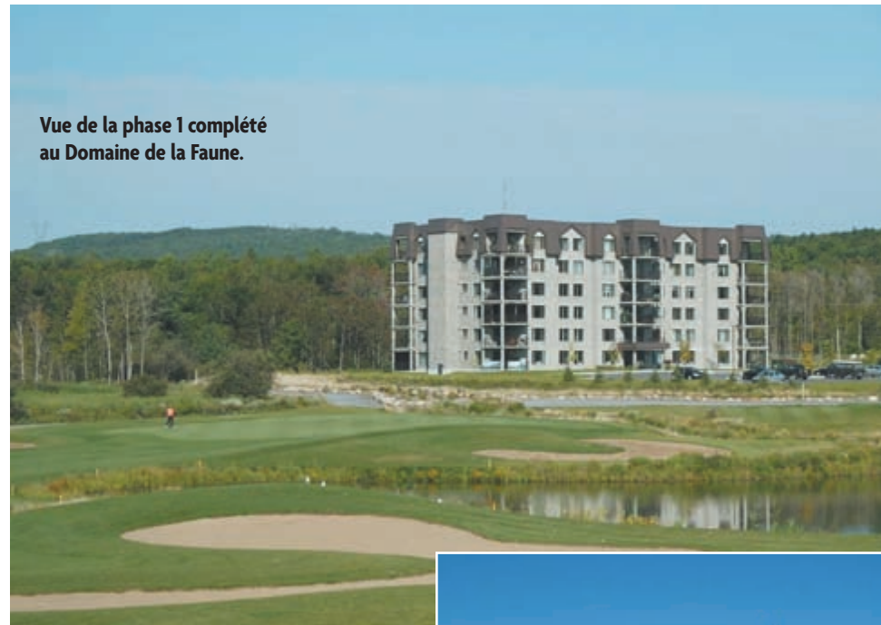
Vue de la phase I complétée au Domaine de la Faune.